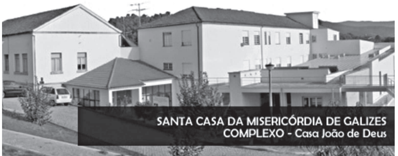
SANTA CASA DA MISERICÓRDIA DE GALIZES COMPLEXO - Casa João de Deus

Mas para melhor conhecermos, como funciona e o que pratica, nada melhor que conhecer o teor da entrevista ao seu actual provedor, feita pelo nosso colaborador, começando pela sua apresentação: